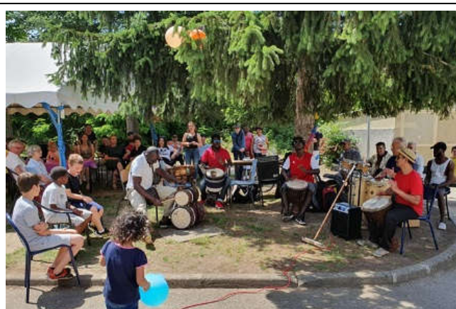
Fête du CADA de Pont de Chéry à l'occasion de la Journée Mondiale des Réfugiés

ATSA : Accueil temporaire au Service de l'Asile. Un dispositif d'hébergement d'urgence national pour demandeurs d'asile créé en 2000.